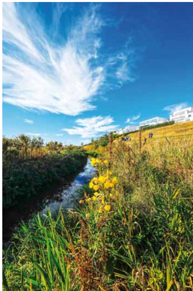
Die renaturierte Emscher am nordöstlichen Ufer vom PHOENIX See.

Zug um Zug werden die Gewässer vom Abwasser befreit und ökologisch verbessert – das Emscher-System kehrt als naturnaher Fluss zu den Menschen zurück. Durch die Veränderungen der Landschaft und der urbanen Räume verwandeln sich ehemalige Meideräume schon jetzt in neue Naherholungsgebiete.